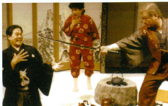
Vying each other in the same "The Marriage Proposal", by the BUNGEIZA and the theatre company from UKRAYINA in Budapest and Debrecen, Hungary, April to May, 2007